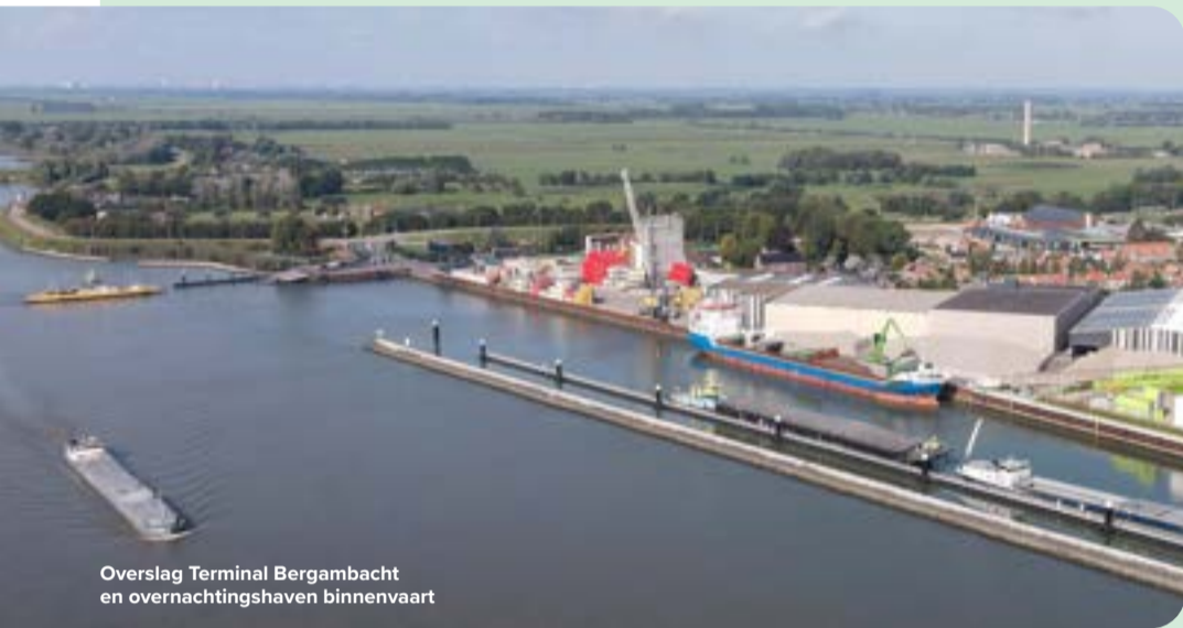
Overslag Terminal Bergambacht en overnachtingshaven binnenvaart

De laatste fase omvat het slopen van het oude veevoedergebouw en het uitvoeren van nieuwbouwplannen. Dit draagt bij aan de verbetering van de Lekdijk in Bergambacht en verzekert de industriële toekomst op die plek. Elkaar de hand geven en blijven praten werpt duidelijk zijn vruchten af.