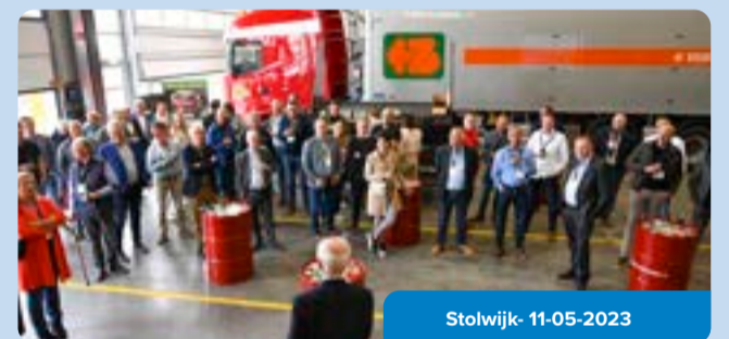
Stolwijk - 11-05-2023