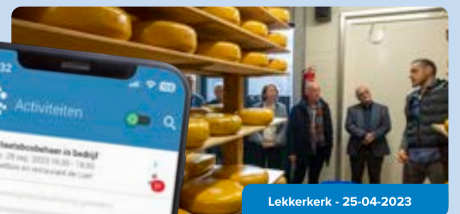
Lekkerkerk - 25-04-2023